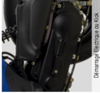
Démarrage Electrique ou Kick

L'Agility 50 est un scooter au design moderne et urbain. Léger et agile, il se faufile facilement dans le flux de circulation et vous accompagnera dans vos déplacements quotidiens grâce à son moteur fiable et économe. Des accessoires en option permettent de l'équiper selon vos besoins (capacité d'emport accrue, confort supplémentaire face au froid, etc.)