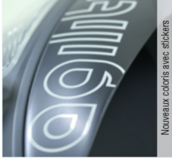
Nouveaux coloris avec stickers