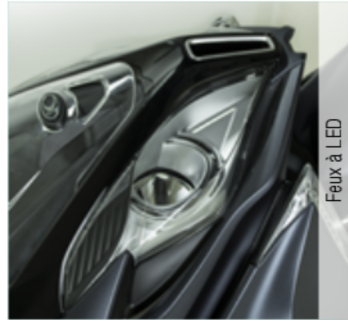
Feux à LED