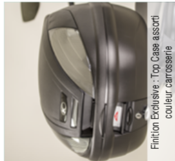
Finition Exclusive : Top Case assorti couleur carrosserie