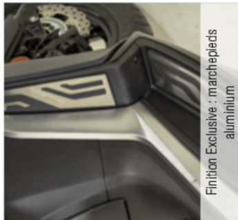
Finition Exclusive : marchepieds aluminium