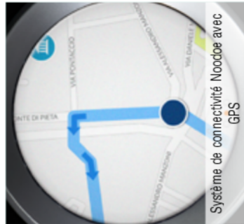
Système de connectivité Noodoe avec GPS