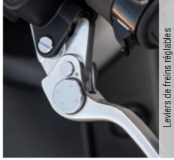
Leviers de freins réglables