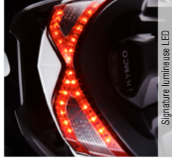
Signature lumineuse LED