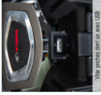
Vide poches dont un avec USB