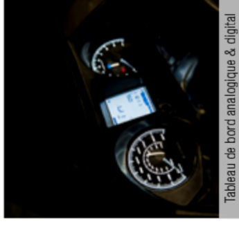
Tableau de bord analogique & digital