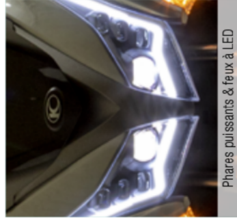
Phares puissants & feux à LED

Une signature lumineuse en X, une polyvalence et un confort exceptionnels, l'X.Town 125 est un GT Urbain par nature. Confortable et performant, l'X.Town est le scooter idéal pour les citadins à la recherche d'un deux-roues fiable pour se déplacer au quotidien. Son aspect compact et son poids bien réparti seront des alliés indispensables pour vous faufiler entre les voitures. Son pare-brise couvrant et son large tablier vous protégeront efficacement même en cas de vent ou de pluie.