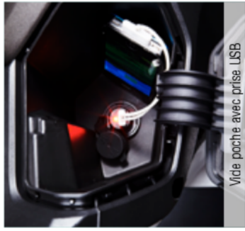
Vide poche avec prise USB