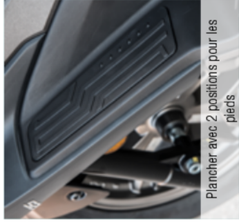
Plancher avec 2 positions pour les pieds