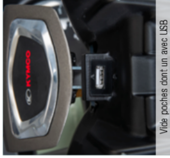
Vide poches dont un avec USB