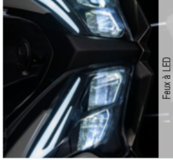
Feux à LED