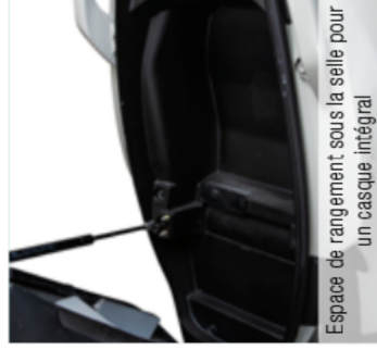
Espace de rangement sous la selle pour un casque intégral