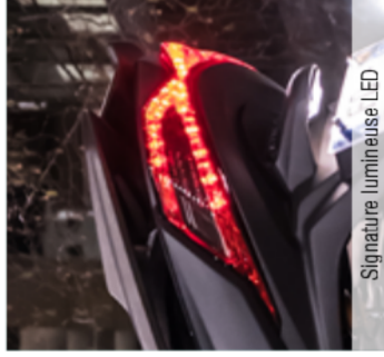
Signature lumineuse LED