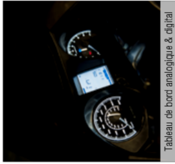
Tableau de bord analogique & digital