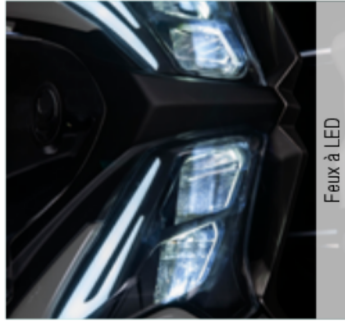
Feux à LED