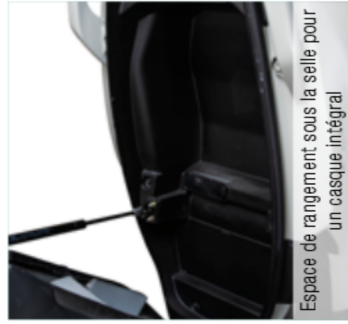
Espace de rangement sous la selle pour un casque intégral