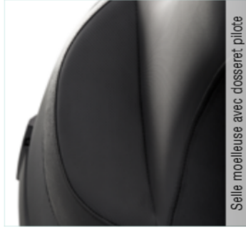
Selle moelleuse avec dossieret pilote