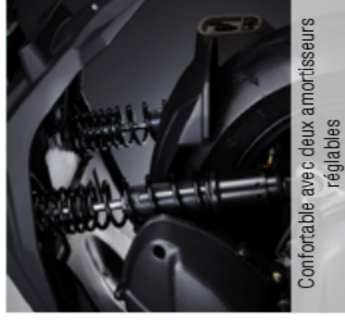
Confortable avec deux amortisseurs réglables