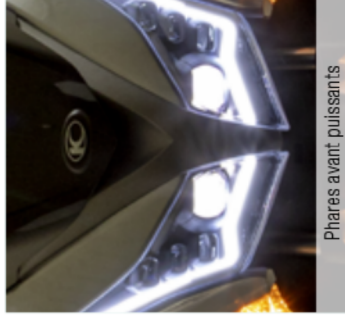
Phares avant puissants